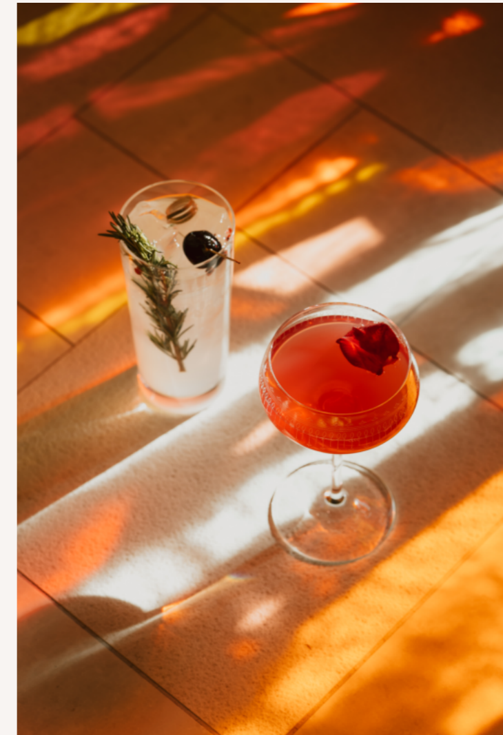
Laboratoire alchimique, le cocktail Centrifugeuse à chagrin d'amour convoque un cordial de vanille et l'acidité du maracuja.